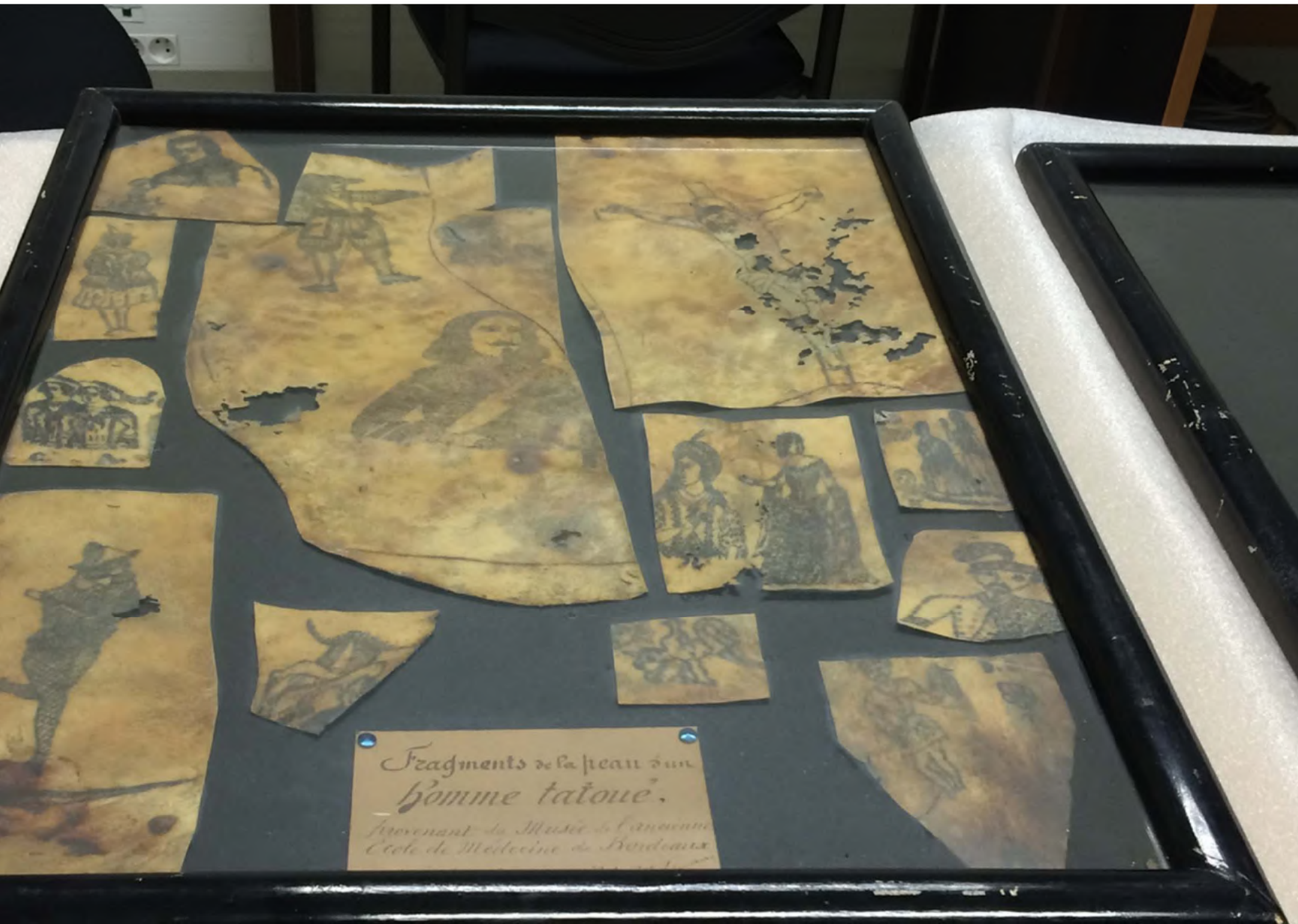
Fragments de la peau d'un homme tatoué. Provenant de Musée de l'ancienne Ecole de Médecine de Bordeaux